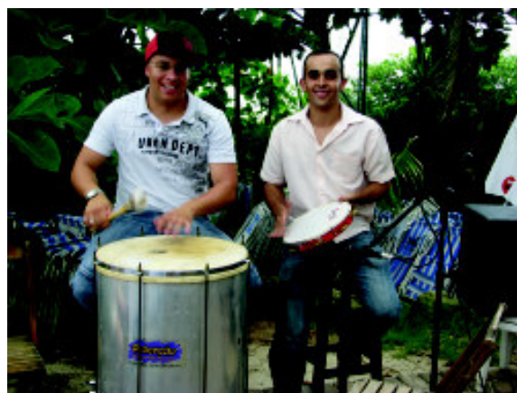
* veja álbum completo no site www.apesp.org.br , na seção eventos.