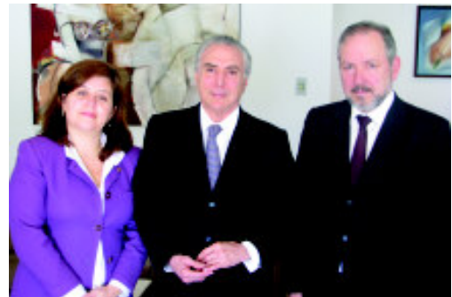
Michel Temer recebe diretores na residência oficial da Presidência da Câmara dos Deputados

entre as carreiras essenciais à Justiça etc. Em 18/08 , Temer já havia recebido o presidente da Apesp no Gabinete da Presidência.