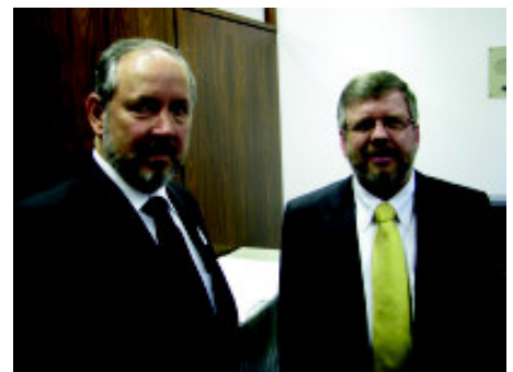
Encontro com o 1º vice presidente da Câmara, deputado Marco Maia (PT RS) (leia texto na pag.01)