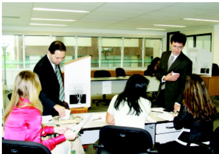
Participação: 607 colegas votaram no interior, na Capital e em Brasília