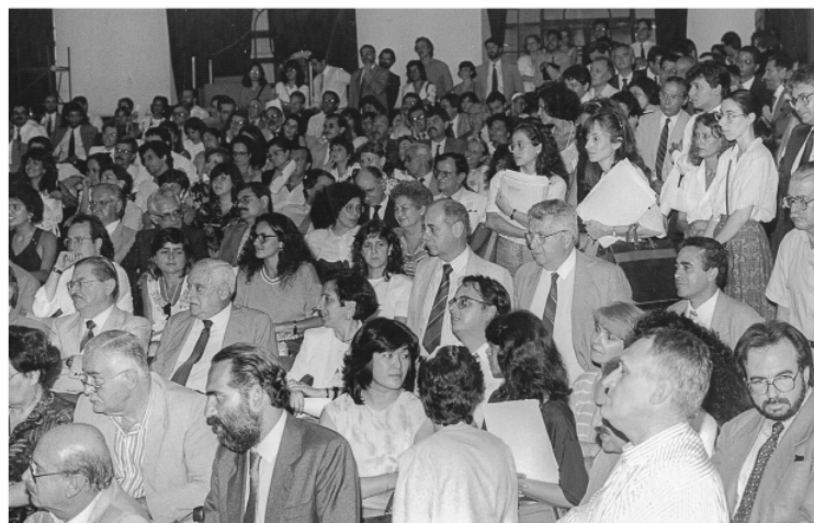
Assembleia Geral Extraordinária da APESP, realizada em 1992, para tratar da sistemática remuneratória dos Procuradores do Estado de São Paulo e o triplique da Verba Honorária.