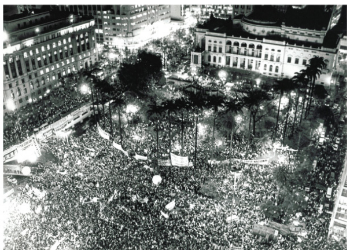
Foto do histórico comício do movimento Diretas Já, realizado em 16 de abril de 1984, no Vale do Anhangabaú. O registro foi feito da janela da sede administrativa da APESP, que na época ficava no 23º andar do Edifício Mercantil Finasa.

O Projeto “Memória APESP” foi criado para resgatar o material fotográfico, a filmografia e os documentos que contam a rica história da Associação dos Procuradores do Estado de São Paulo e, por consequência, da Procuradoria Geral do Estado de São Paulo. Além disso, serão produzidas entrevistas em vídeo com importantes personagens que ajudaram a construir a Procuradoria paulista! Faça parte deste projeto! Caso tenha algum material histórico que deseje divulgar, envie uma mensagem para o email apesp@apesp.org.br