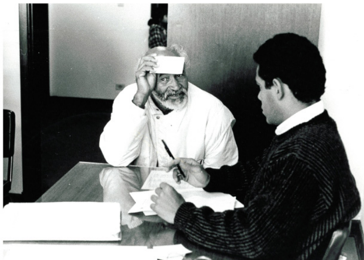
Atendimento ao cidadão na antiga Procuradoria de Assistência Judiciária