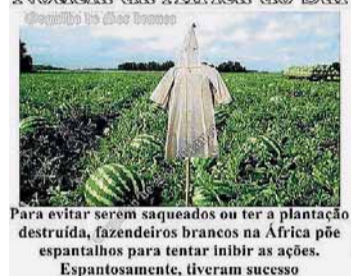
Para evitar serem saqueados ou ter a plantação destruída, fazendeiros brancos na África põe espantalhos para tentar inibir as ações. Espantosamente, tiveram sucesso